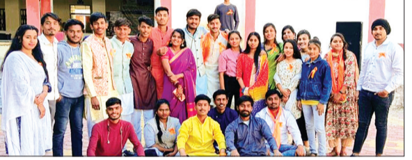
हरिभूमि न्यूज ▶ देवास