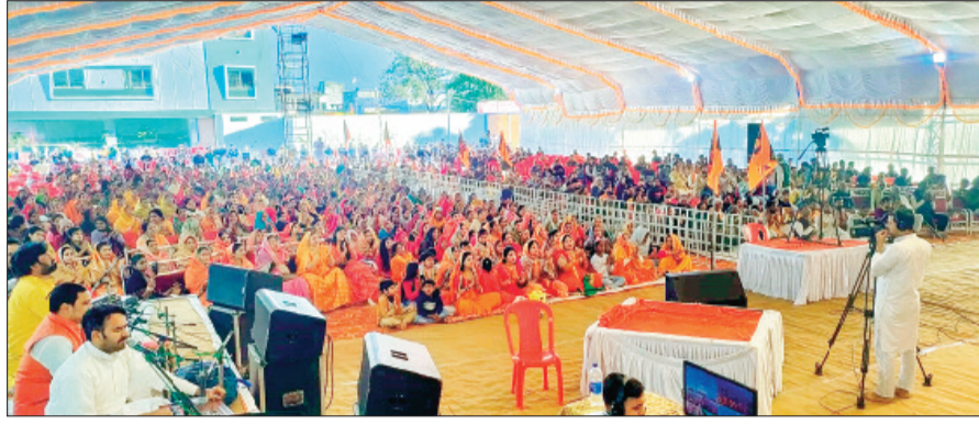
दिए। उन्होंने बताया कि लोग जन्म से ही महाभारत लड़ रहे हैं। पृथ्वी पर जन्म लेने के उपरांत जैसे ही बुद्धिमान होने लगते हैं, व्यक्ति के जीवन में महाभारत शुरू हो जाती। महाभारत सबकी चल रही है। बस हमें यह बता